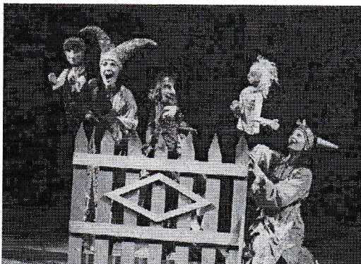
2 3.5. Кукольный театр.