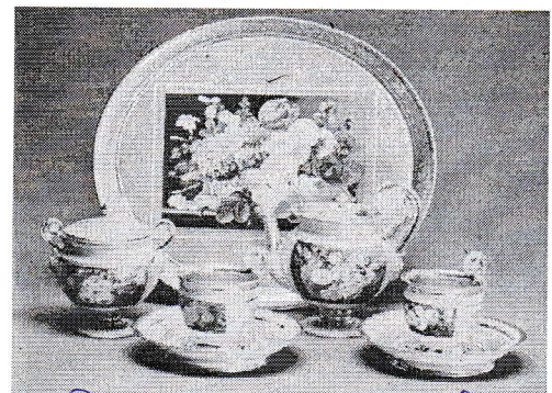
3.4. Роспись на посуде ДТН