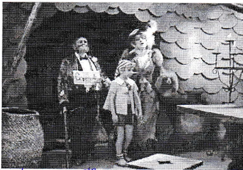
2 3.3. Аниме кино.